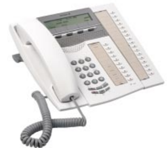
MD Evolution System telephone